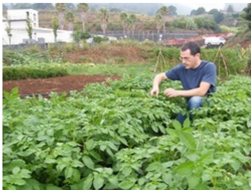
Huerto ecológico en Breña Alta, La Palma.

Para su selección se ha tenido en cuenta la participación en otras iniciativas que requieren una cierta sensibilidad con esta filosofía, como la participación en el Proyecto de Huertos Escolares o la Red de Canarias de Escuelas Promotoras de Salud.