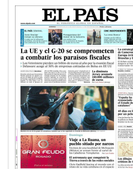
Portadas del día Portadas del 19 de mayo de 2013