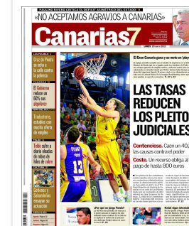
Portadas del día Álbum: las portadas del día (20/05/2013)